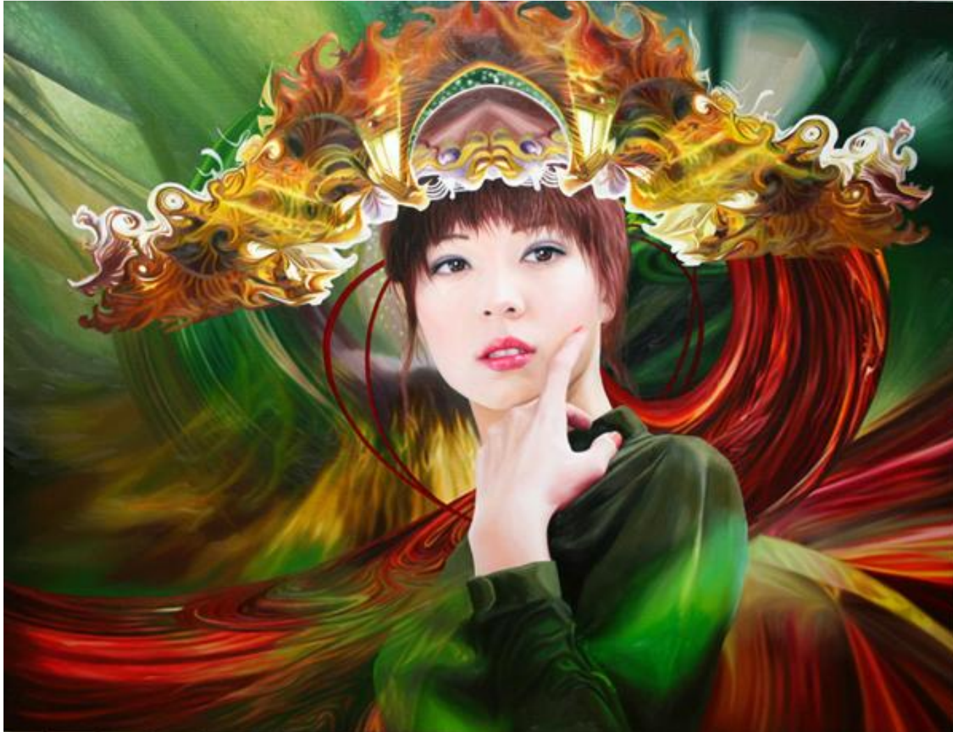
◆ 아름다움은 강렬한 확산이다! / 50호 F(116.7cm X 90.9cm)/ Oil on canvas / 2008