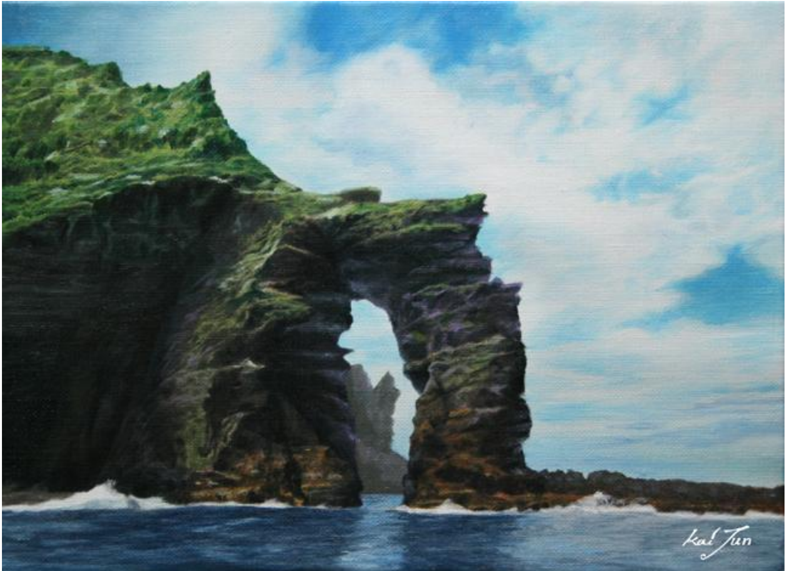
◆ 독립문 바위 / 4호 F(33.3cm X 24.3cm) / Oil on canvas / 2008