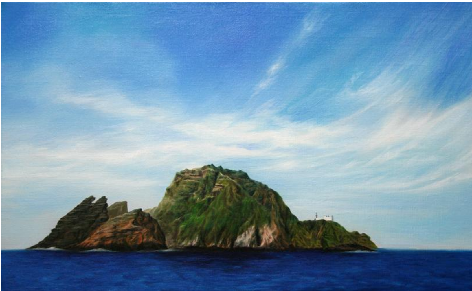
◆ 서쪽에서 본 독도 / 10호 M(53cm X 33.3cm) / Oil on canvas / 2008