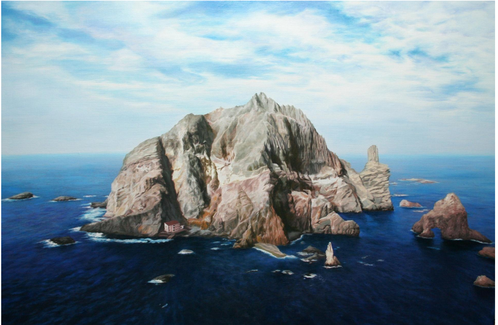
◆ 찬란히 빛나는 서도 / 30호 M(90.9cm X 60.6cm) / Oil on canvas / 2008