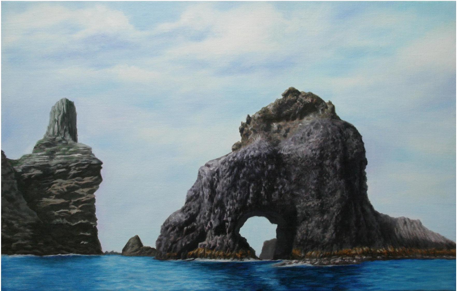
◆ 삼형제굴바위와 탕건봉 / 10호 M(53cm X 33.3cm) / Oil on canvas / 2008