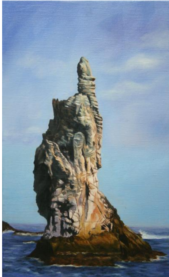
◆ 좃대바위 / 8호 M (27.3cm X 45.5cm) / Oil on canvas / 2008